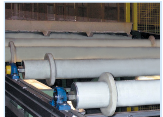
Eine abriebfeste Oberfläche schützt die Produkte